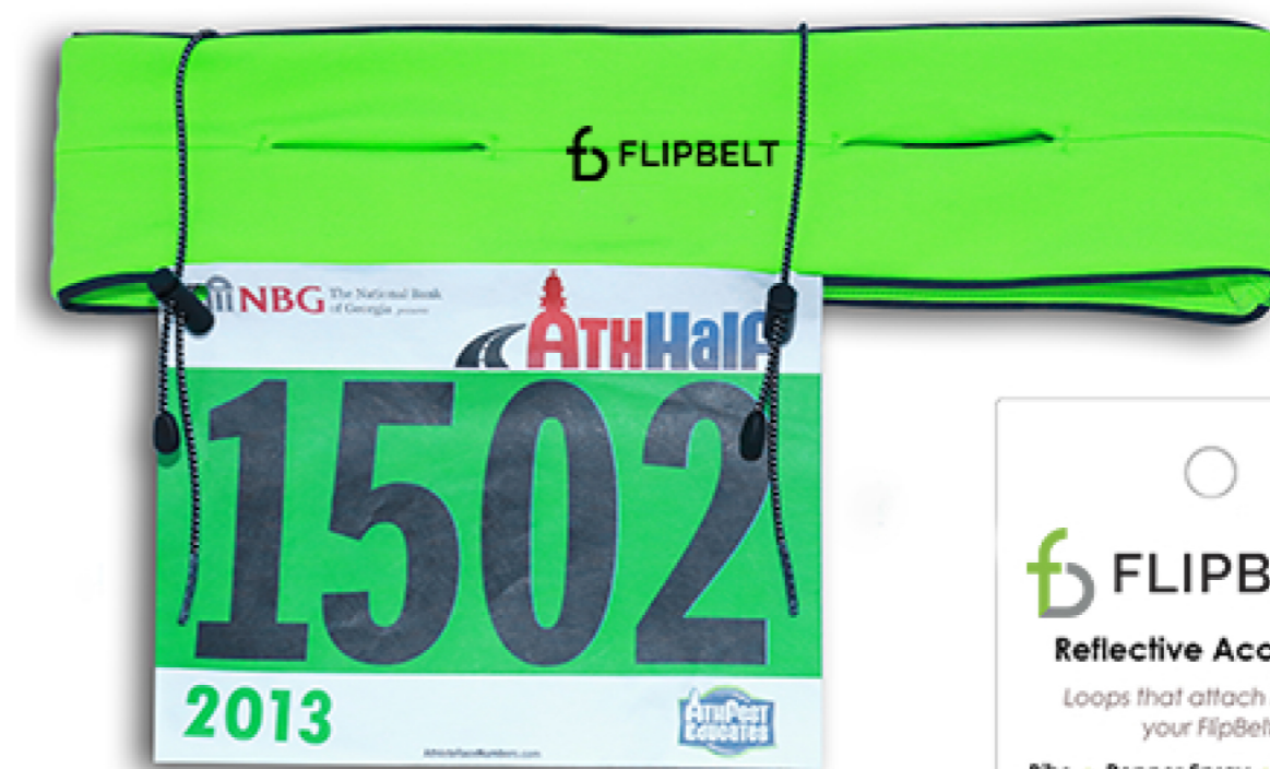
BIP ATTACHERS BA-0415

Peut être utilisé sur n'importe quelle FlipBelt et n'importe quel numéro de départ équipé d'oeillets