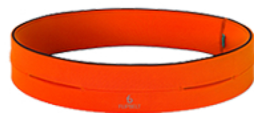
NEON PUNCH FB0114-NEOP