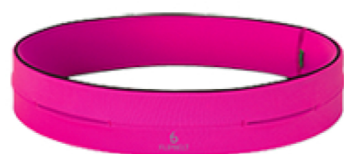
HOT PINK FB0114-HPK