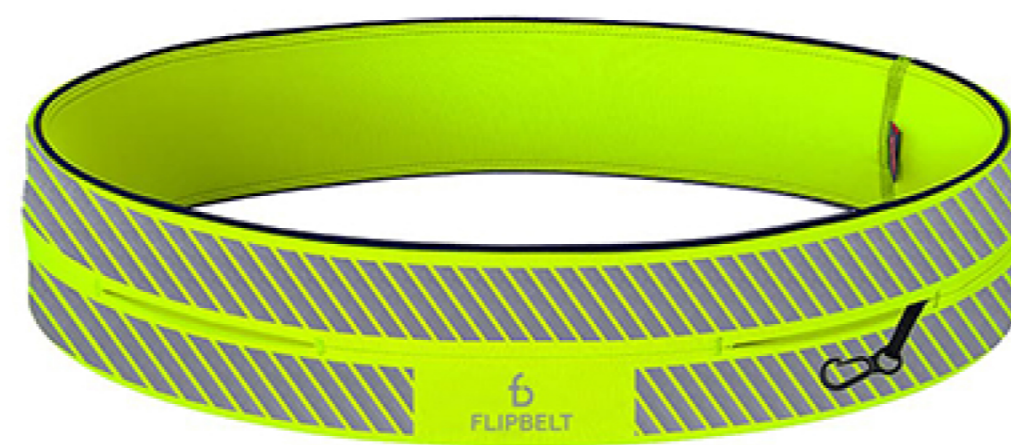
NEON YELLOW FB0130-NEOY