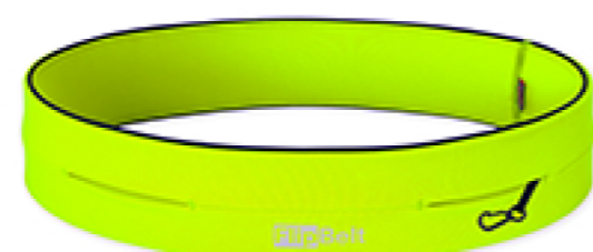
NEON YELLOW FB0114-NEOY