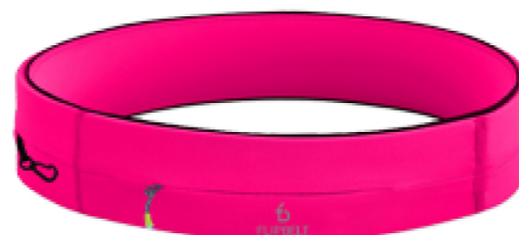
HOT PINK FB0114-HPK